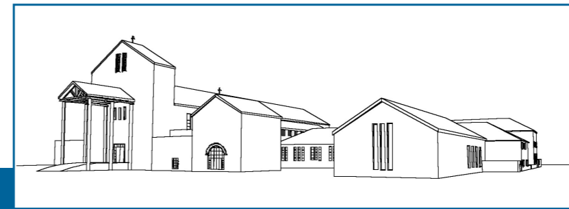
Projekt konkursowy – Świątynia Opatrzności Bożej