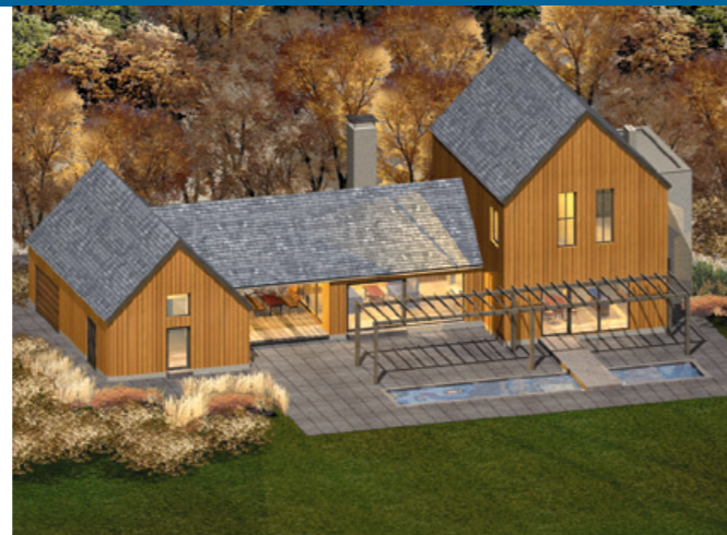
Ciepły kolor drewnianej, modrzewiowej elewacji najefektowniej prezentuje się jesienią, na tle żółknących, płomiennych liści