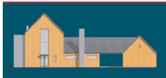
Widok elewacji: frontowej, bocznej ogrodowej, ogrodowej, bocznej garażowej

Szerokie, dwuskrzydłowe, przeszklone drzwi w bryle głównej prowadzą do ponad dwudziestometrowego holu z otwartą antresolą w kształcie litery C, nad którą pozostawiono odkrytą więźbę ▶