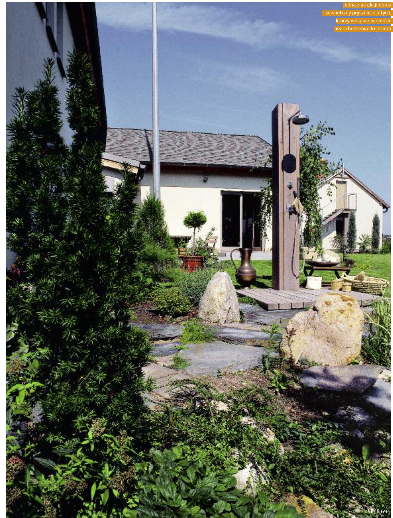
Jedną z atrakcji domu – zewnętrzny prysznic, dla tych, którzy wolą się ochłodzić bez schodzenia do jeziora