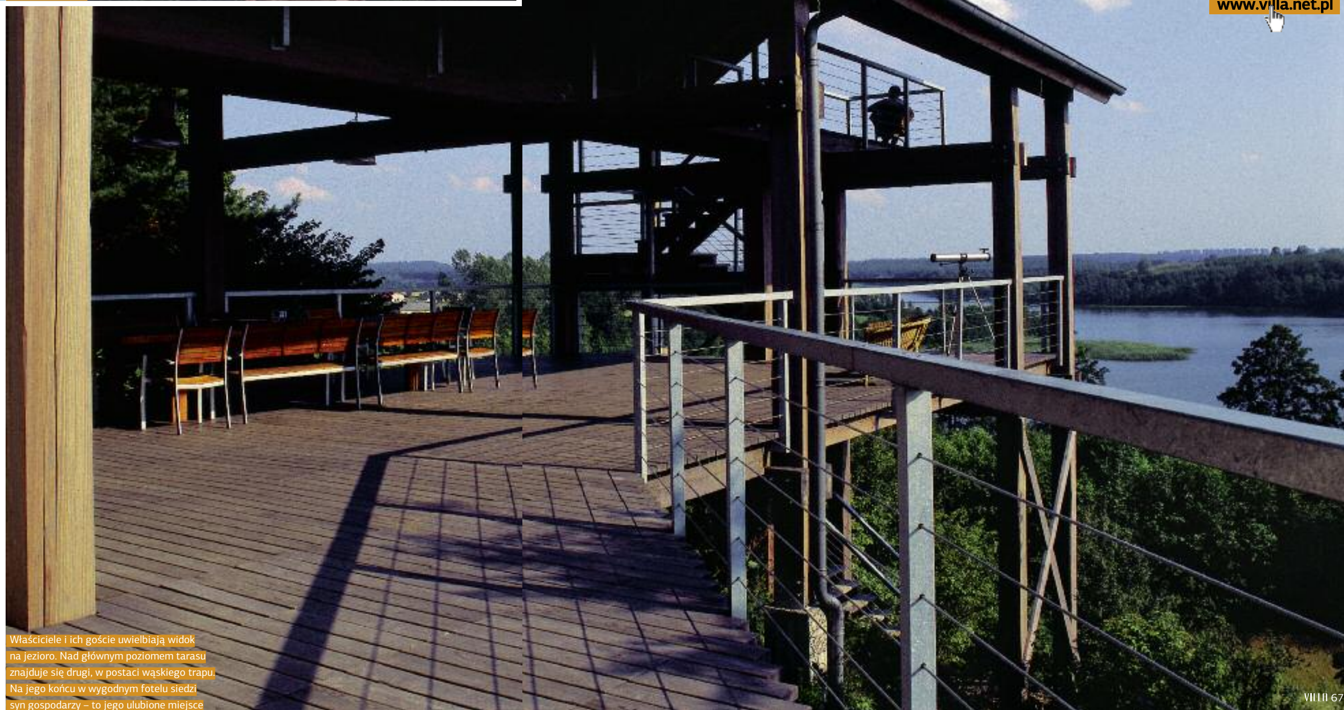
Właściciele i ich goście uwielbiają widok na jezioro. Nad głównym poziomem tarasu znajduje się drugi, w postaci wąskiego trapu. Na jego końcu w wygodnym fotelu siedzi syn gospodarzy – to jego ulubione miejsce

Kiedy architektki po raz pierwszy przyjechali zobaczyć przyszłą lokalizację, byli zaskoczeni krajobrazem. – Spodziewaliśmy się bardziej płaskiego terenu, a zastaliśmy malownicze wzniesienia i doliny wyrzeźbione przez lodowiec – opowiadają. To mało znane pojezierze, z pięknym krajobrazem, w odległości około dwustu kilometrów od Warszawy. Od razu zaczęli namawiać inwestora, żeby dom stanął nie na płaskim terenie (jak pierwotnie planowali właściciele), ale żeby przesunąć go w stronę jeziora i zawiesić częściowo nad skarpą. – Było dla nas jasne, że musimy wykorzystać walory widokowe, że nie można zmarnować takiego potencjału – mówią architektki. —>