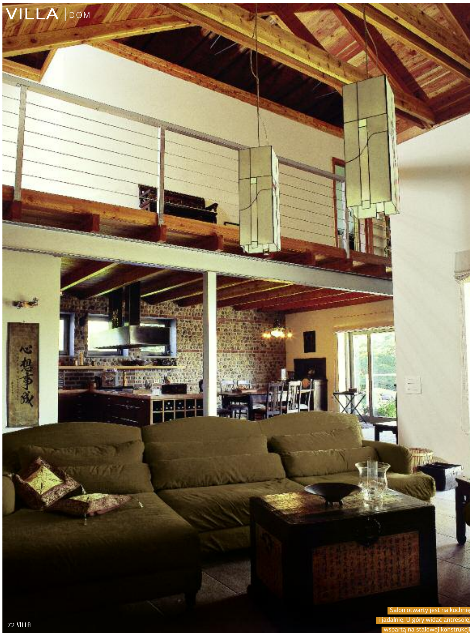
Salon otwarty jest na kuchnię i jadalnię. U góry widać antresolę, wspartą na stalowej konstrukcji