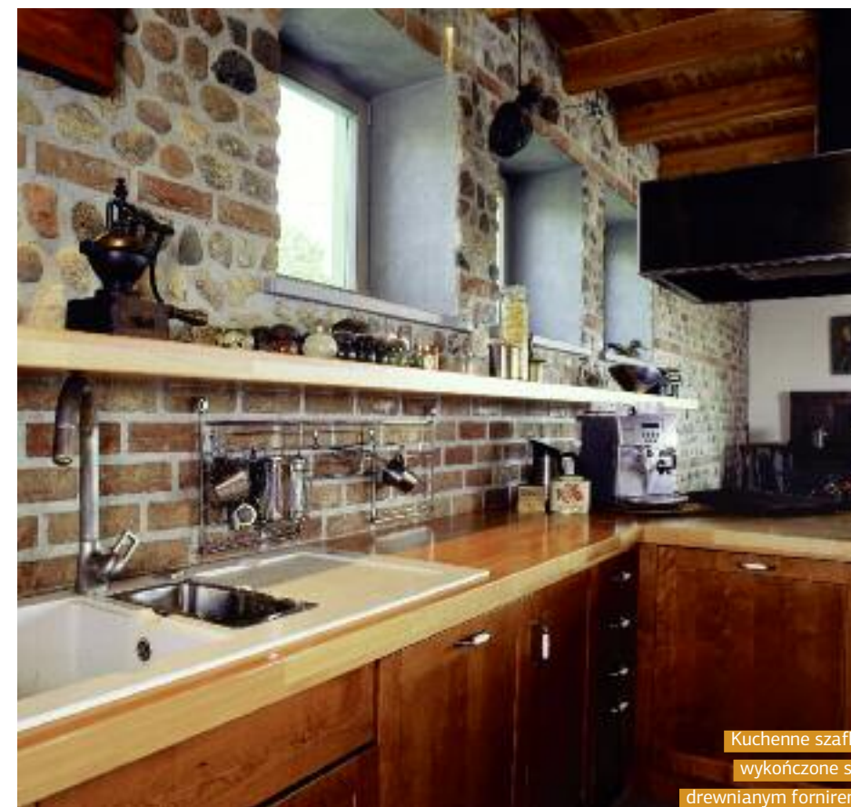
Kuchenne szafki wykończone są drewnianym fornirem