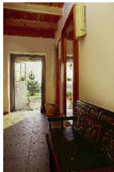
Główne wejście do domu widoczne od strony korytarza do sypialni