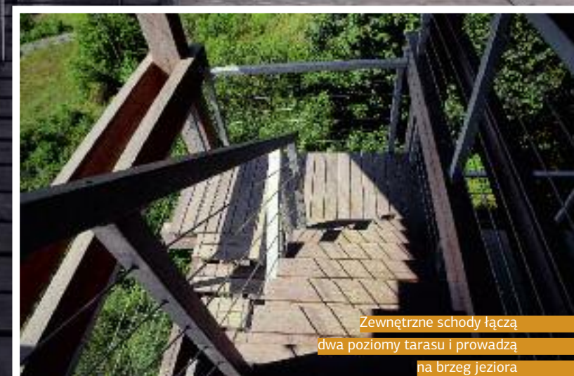
Zewnętrzne schody łączą dwa poziomy tarasy i prowadzą na brzeg jeziora