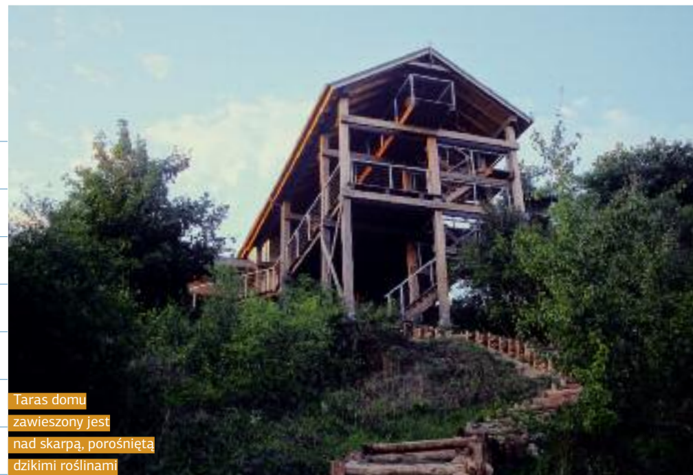
Taras domu zawieszony jest nad skarpą, porośniętą dzikimi roślinami

WŁAŚCICIELE SĄDZILI, ŻE PONAD CZTEROMETROWY STÓŁ NA TARASIE BĘDZIE ATRAKCJĄ TYLKO DLA GOŚCI. DZIŚ NIE WYOBRAŻAJĄ SOBIE ŚNIADANIA W INNYM MIEJSCU, WYGONIĆ ICH STĄD MOŻE JEDYNIIE SZTORM LUB ŚNIEG. TU MOGĄ W PEŁNI CIESZYĆ SIĘ NAJWIĘKSZĄ ZALETĄ TEGO DOMU – FANTASTYCZNYM WIDOKIEM NA JEZIORO