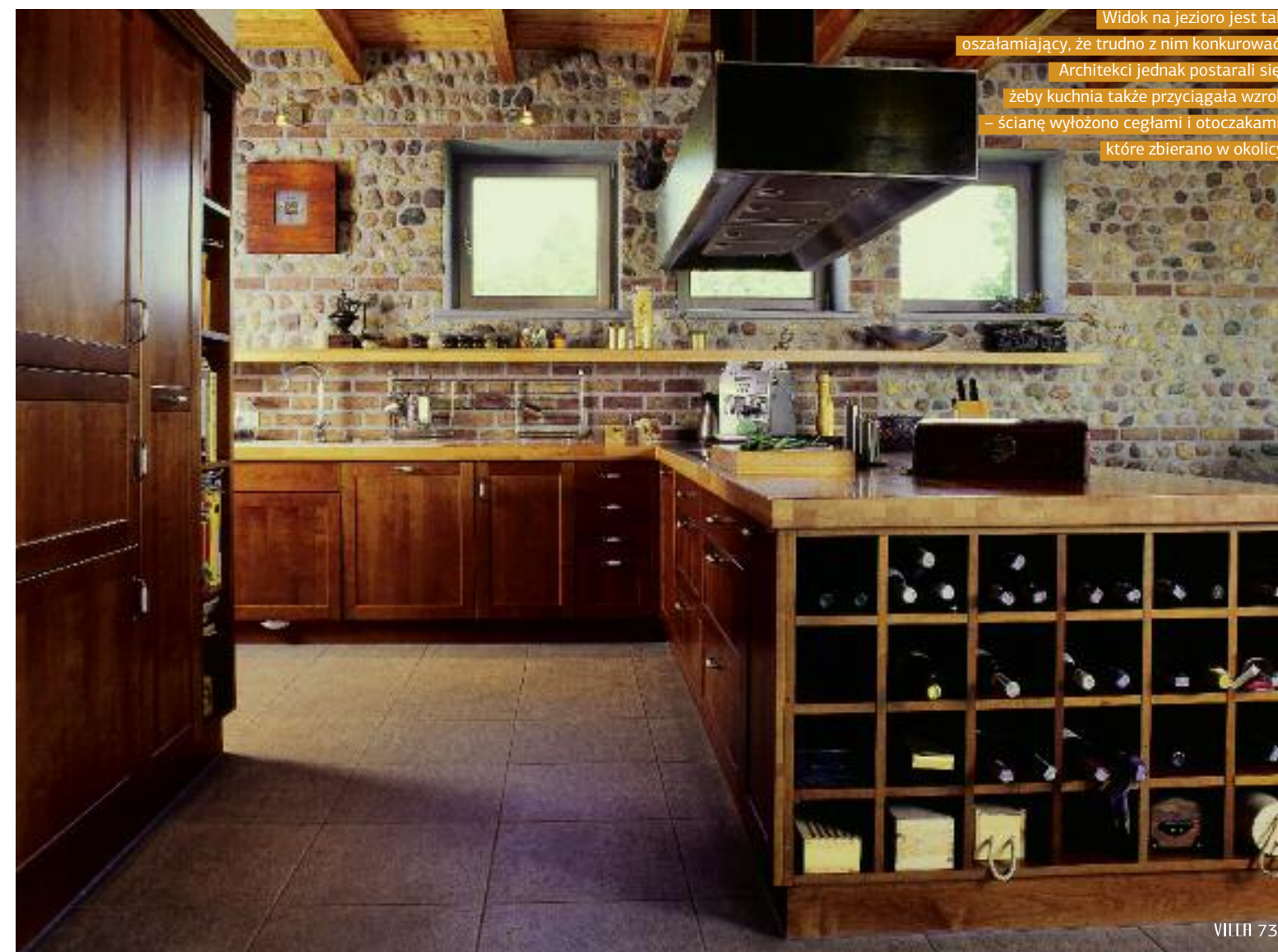
Widok na jezioro jest tak oszałamiający, że trudno z nim konkurować. Architekci jednak postarali się, żeby kuchnia także przyciągała wzrok – ścianę wyłożono cegłami i otoczkami, które zbierano w okolicy

Na tarasie stoją fotele i ponad czterometrowy stół z krzesłami. Tylko bardzo zła pogoda sprawia, że domownicy i ich goście przenoszą się do wnętrza domu. Właściciele przyznają, że stół w gruncie rzeczy mógłby być nawet dłuższy. Lamy nad nim trzeba było dociążyć łożem – w trakcie silnych wiatrów zbyt mocno się kołysały.